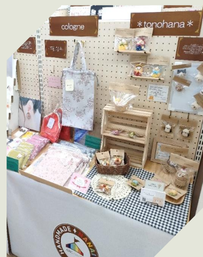
BOXタイプ W45 x D45 x H60cm