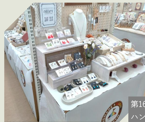
ステージタイプ W90 x D45 x H60cm (壁面ステージ H約80cm)

第16回 ハンドメイド ナナイロマルシェから 壁面ゴンドラタイプは 廃止となります。 売場は拡大予定です。