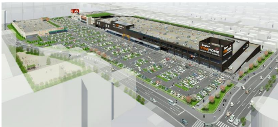
スーパービバホーム名古屋南店の外観イメージ図

「スーパービバホーム名古屋南店」は、地域の皆様と共により良い生活環境と防災・減災に取り組み、生活基盤産業としてのホームセンターを目指して、地域社会に貢献してまいります。