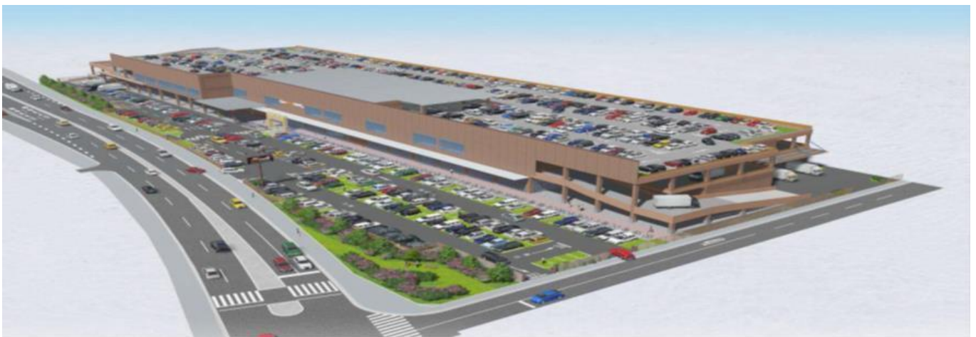
▲スーパービバホーム厚木南インター店の外観イメージ図

「スーパービバホーム厚木南インター店」の開店により、「スーパービバホーム」は39店舗となり、中小規模店舗の「ビバホーム」と合わせ、LIXILビバの店舗数は88店舗となります。LIXILビバは、地域密着型のホームセンターを各地で充実させるとともに、環境に配慮した店舗づくりを推進していきます。